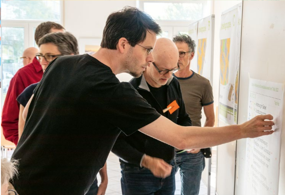
Beim Esche-Workshop im Mai 2022