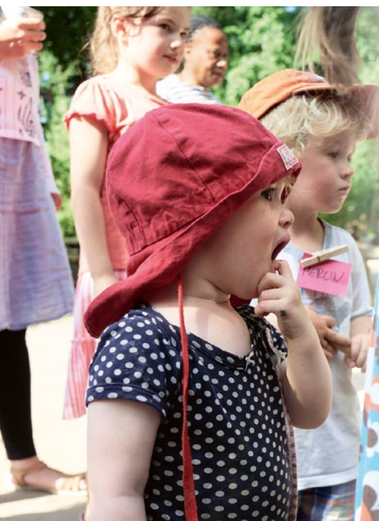
Auf dem Esche-Sommerfest im Juli 2021